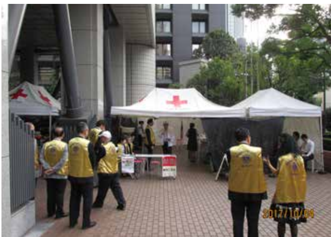
⑪献血会場設営風景