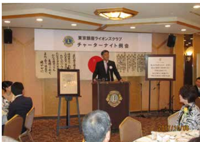
⑤CN担当 柳井第一副会長挨拶