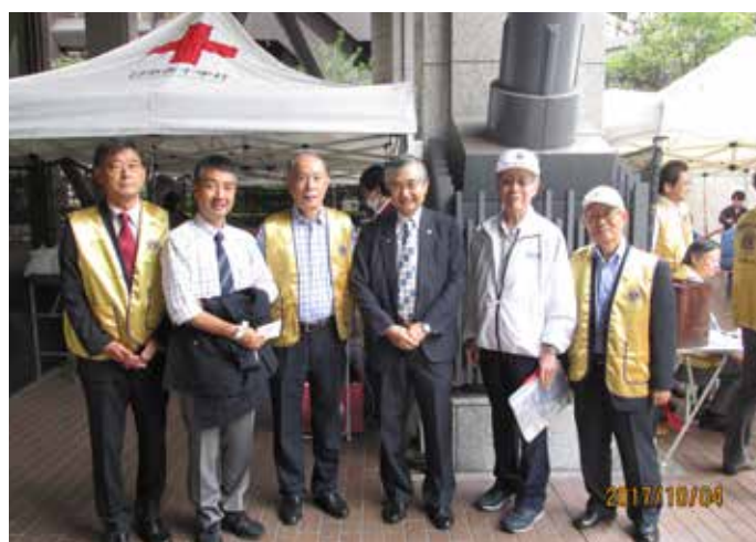
④献血をした大貝L(左から2人目)を囲んで