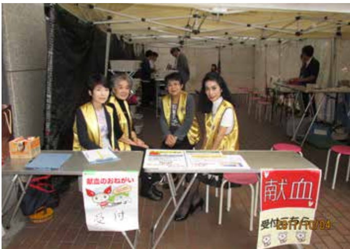
⑨回復された仲第三副会長(左から2人目)を囲んで