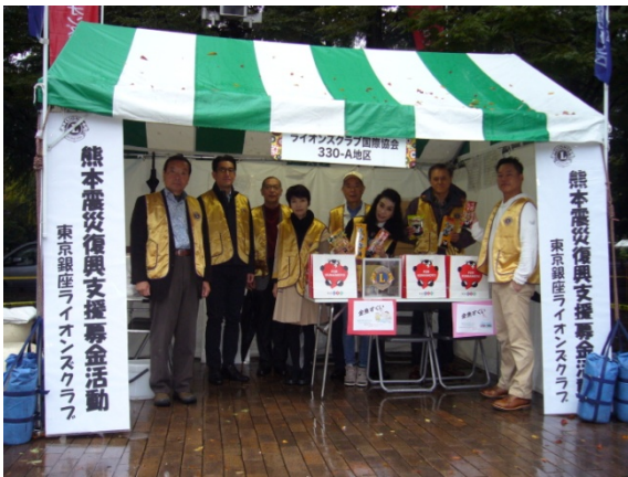
①参加メンバーと割り当てられたブース

備品の搬入や事前のお菓子、金魚を用意するために活躍されたライオンの皆さま、当日の手伝いに参加された皆様ご苦労様でした。