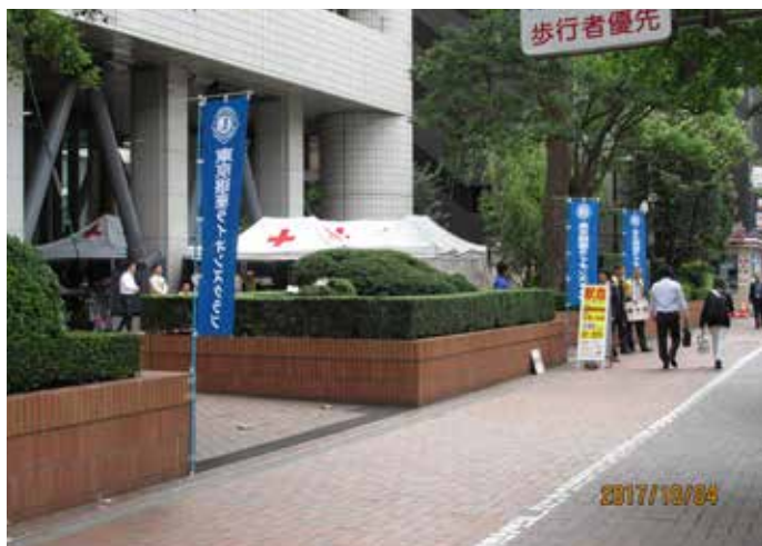
①献血会場 電源開発会社ビル前広場