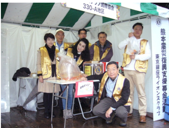
③子供達の金魚すくいのために用意した金魚も行き場がなくなりました。