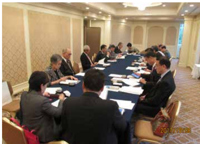
②理事会 帝国H 桐の間