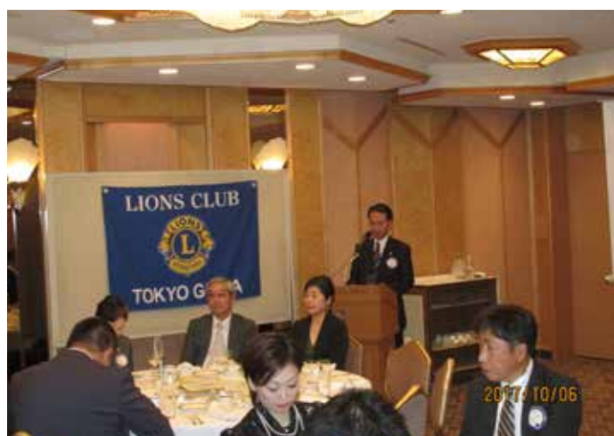
⑨テールツイスターの時間