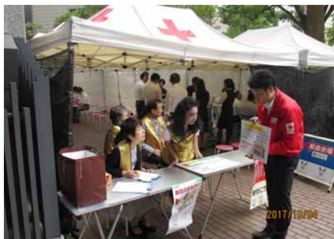
⑥献血条件について日赤のスタッフからの説明を聞く