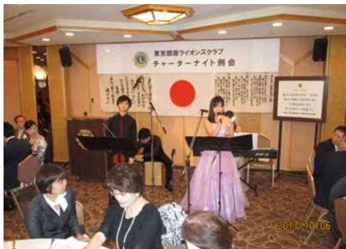
⑭アトラクションのフルーツ&バイオリンの演奏