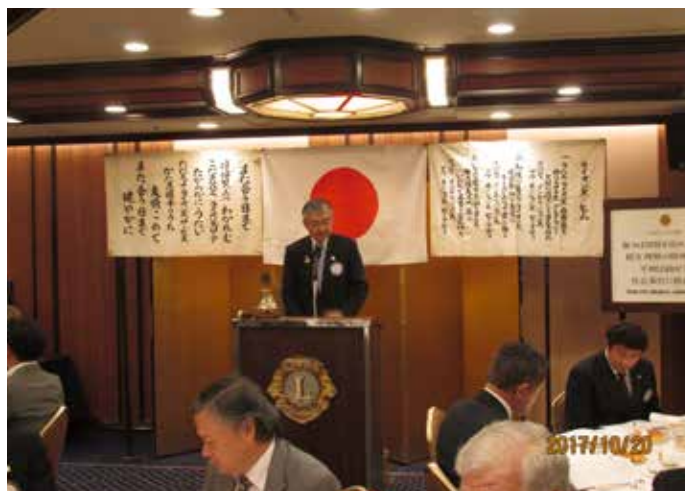
② 越村会長 挨拶 出席されたペットの会議の講演についてと先日の結婚記念日に46本のバラを贈られたことなどを話されました。