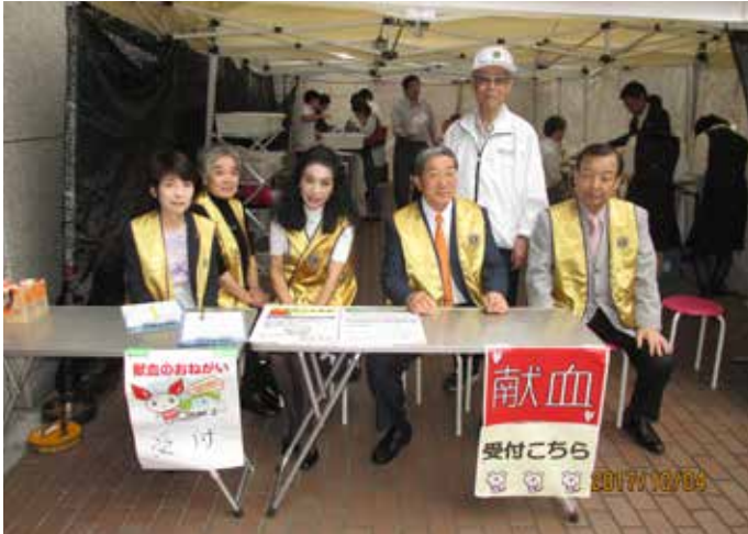
⑦山田前会長(前列右から2人目)も参加