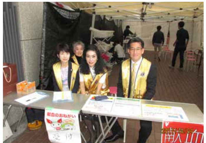
⑩宇田第二副会長(右端)も参加