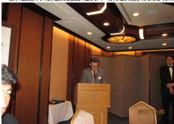
⑪出席率の報告 平石L