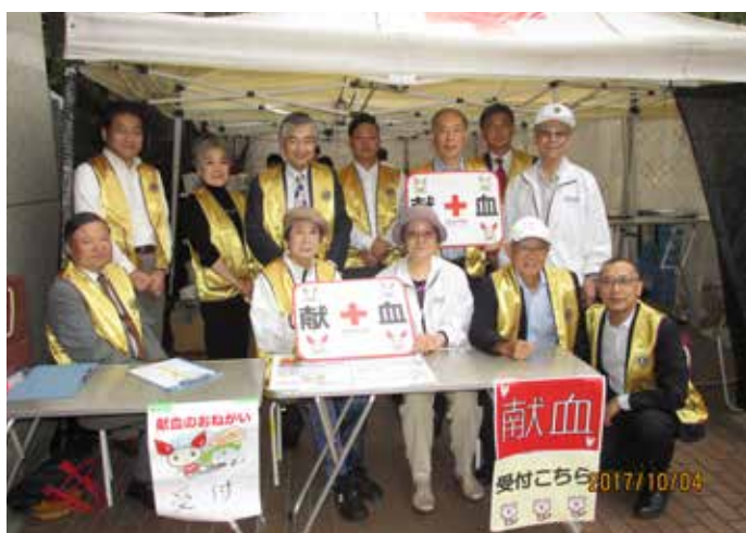
③献血受付のサポート 参加メンバー