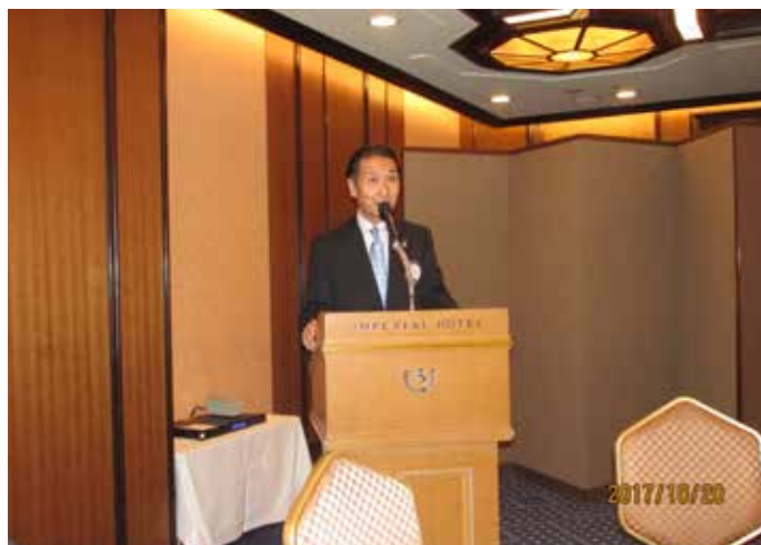
⑧テールツイスターの時間 渡辺L今回は父上が吉田茂元首相の官邸料理長であったことや元首相が大磯の自宅で 居留守がばれた際に怒った訪問客に「本人が言ったるのだから間違いないだろう」と言い放った事が披露されました